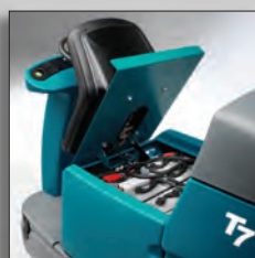
Аккумуляторы с продолжительным циклом работы