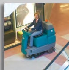
Машина в работе