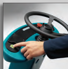
Запуск работы одной кнопкой