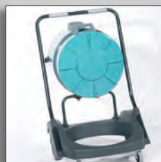
Бак легко опрокидывается для слива