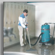
Пылеводосос в работе