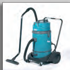
Большая вместимость V14 с тележкой