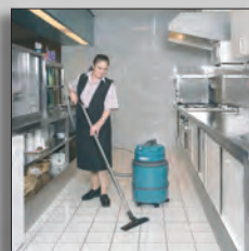
Пылеводосос в работе